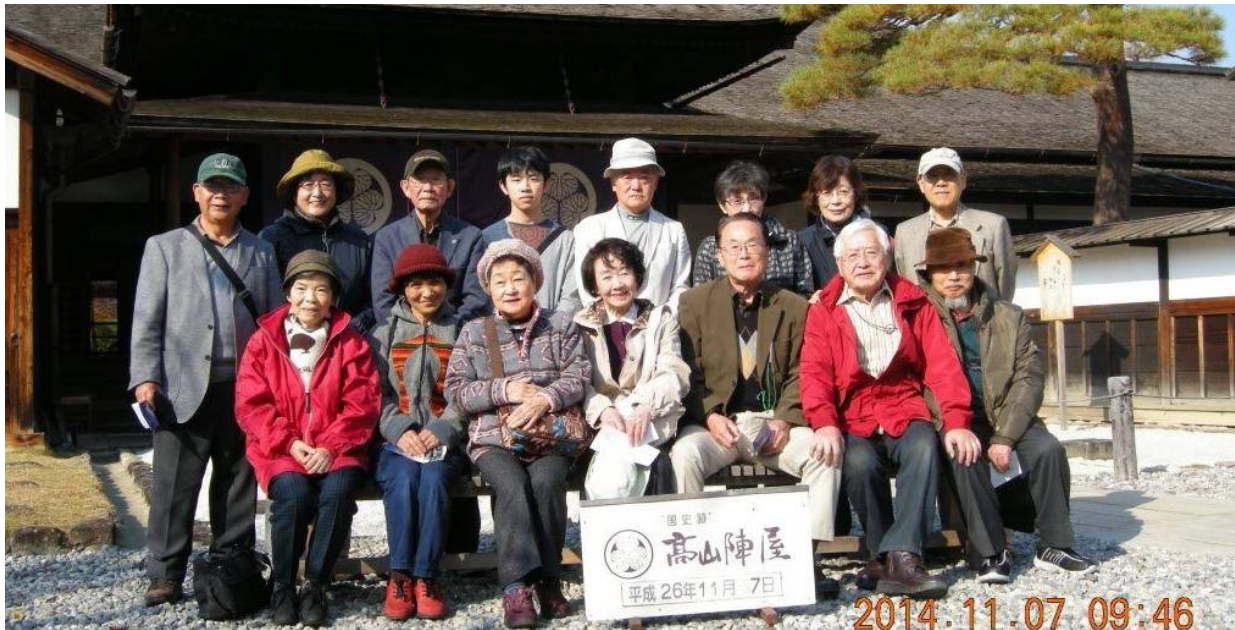
飛騨高山 陣屋での記念撮影