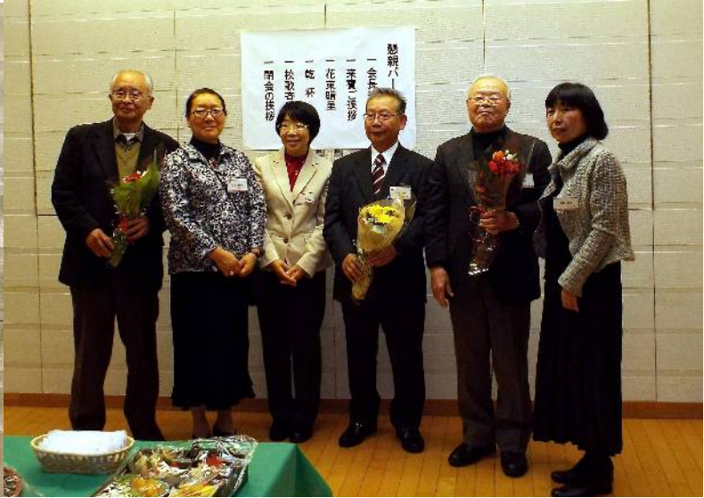
歴代会長への花束贈呈