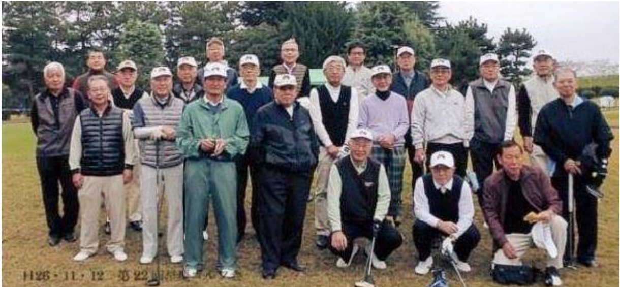
三田会対抗戦の戦士たち