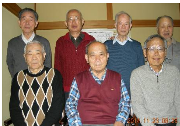
囲碁の宿 越後屋合宿参加の面々

11月22日・23日に囲碁部会恒例の合宿囲碁会を行いました。会場は秩父郡小鹿野町の囲碁の宿・越後屋旅館で、ここ数年は囲碁部会の定宿になっています。この時季の秩父駅周辺は例年秩父夜祭の準備であわただしく、見物座席の設営や屋台の準備などでにぎわっているのですが、今年は暦の関係で少し早かったようで忙しそうな様子はありませんでした。秩父駅から小鹿野町までの約10kmは晩秋の絶景というほどではないが、奥秩父の山々をいろどる紅葉がかなりの見頃を迎えていました。