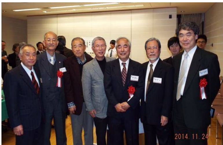
近隣稲門会からのご来賓各位