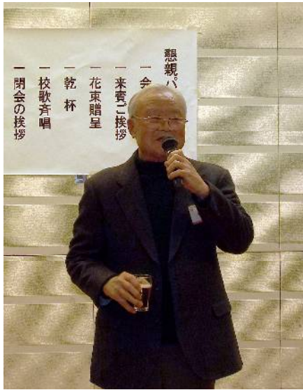
安宅初代会長による乾杯