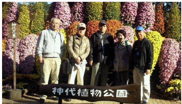
ウォーキング参加の 5 名

秋の好日、絶好のウォーキング日和にも拘わらず、参加者 5 名と寂しさの中にも充実した一日を過ごした。先ず、野川公園は、昭和 55 年 6 月に開園した、豊かな水と緑に恵まれた野趣に富む公園で、前身は国際基督教大学のゴルフ場でした。公園は、調布、小金井、三鷹の三市にまたがる広大な敷地を有し、野川と都道 246 号線（東八道路）とで三つの地区に分かれている。休日に当たり園内では野外のジャズ演奏会を始め色々なイベントが行われており、我々もひと時その一部に参加して楽しんだ。