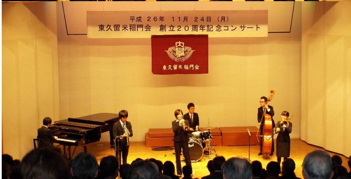
上：大門中学校 吹奏楽部