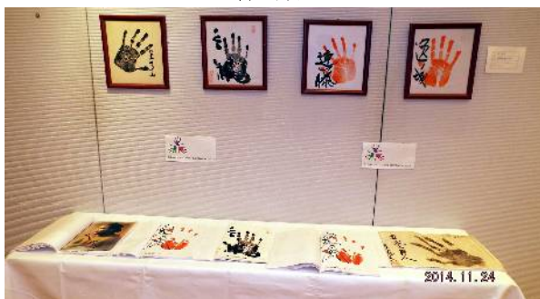
大相撲力士の手形