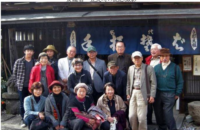
妻籠宿 昼食時の記念撮影

宿泊は名湯下呂温泉です。筆者は以前名古屋に勤務していた時仕事で何回も下呂温泉には来たのですが、車で丁度日帰り出来る距離で泊まった事がなく今回の旅の楽しみの一つでした。宿泊は下呂温泉で第一といわれる水明館です。下呂温泉は有馬、草津と並んで日本三名湯に数えられているだけあって肌にしっとりと馴染む泉質はさすが名湯の名に恥じ