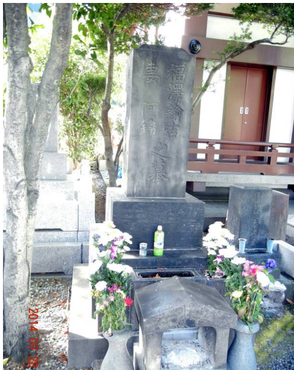
善福寺 福沢諭吉の墓

外苑通りを南へ戻り、 国立新美術館 の前を通過して長府藩毛利家の上屋敷跡に建つ 六本木ヒルズ に至り、タワーに隣接した 毛利庭園 を散策。