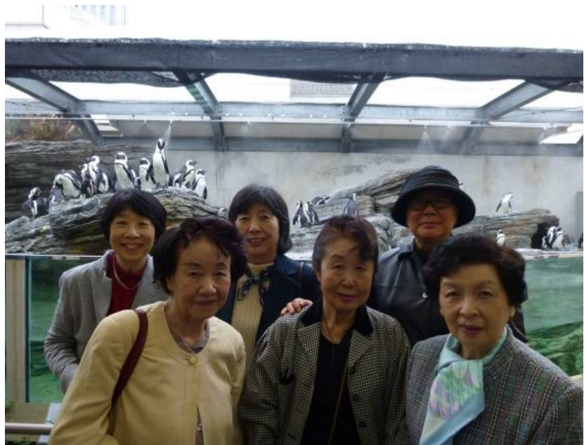
サンシャイン水族館にて